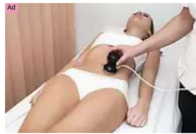
LIPOSUCTION IN MEXICO | SEARCH ADS Liposuction In Mexico: Prices May Surprise You!