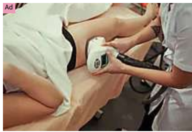
LIPOSUCTION | SEARCH ADS Here's What Laser Liposuction Should Cost You In 2022 (Search Here)