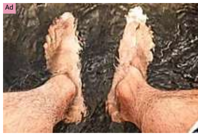
EELHOE Here's How To Tackle Nail Fungus Fast